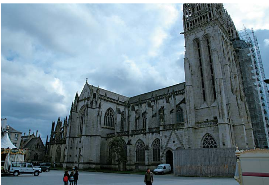
Cathédrale de Quimper