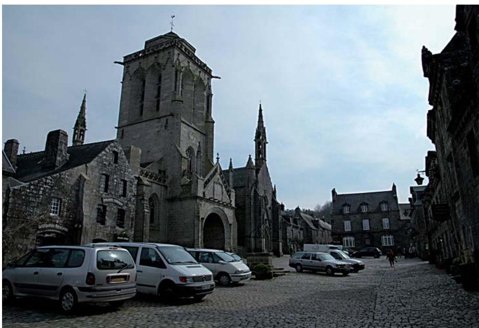
La place centrale de la cité de Locronan