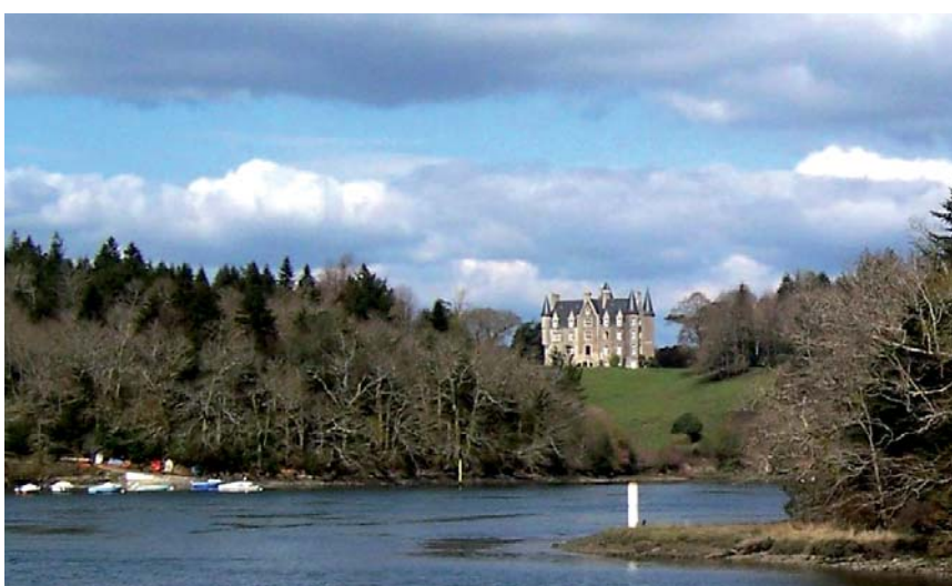
La rivière de l'Odét

XII e siècle dans le quartier primitif de Quimper, le quartier Locmaria, ancien prieuré avec un jardin médiéval. L'ancien palais des évêques abrite maintenant le musée départemental breton.