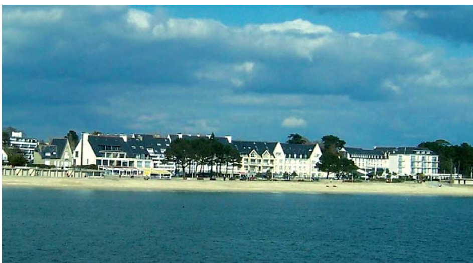
Terre de Bénodet , vue sur l'hôtel du CRE-RATP

Chacun peut recevoir dix soins différents, à savoir : modelage sous affusion, mass-modelage, modelage au jet, bain bouillonnant ou hydro massant, enveloppement d'algues ou de boues sans oublier le bassin d'eau de mer, le sauna, le hammam et autres salles de gymnastique ou d'aromathérapie.