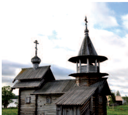
Ile de Kiji