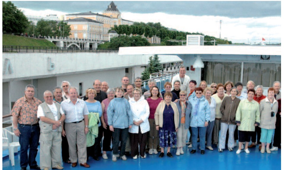
Le groupe LSR en Russie

Une iconostase est un cloison, de bois ou de pierre, qui sépare les lieux où se tient le clergé célébrant (sanctuaire, autel) du reste de l'église où se tiennent le chœur, le clergé non célébrant et les fidèles. Elle cache les célébrants aux regards de l'assemblée pour pré-