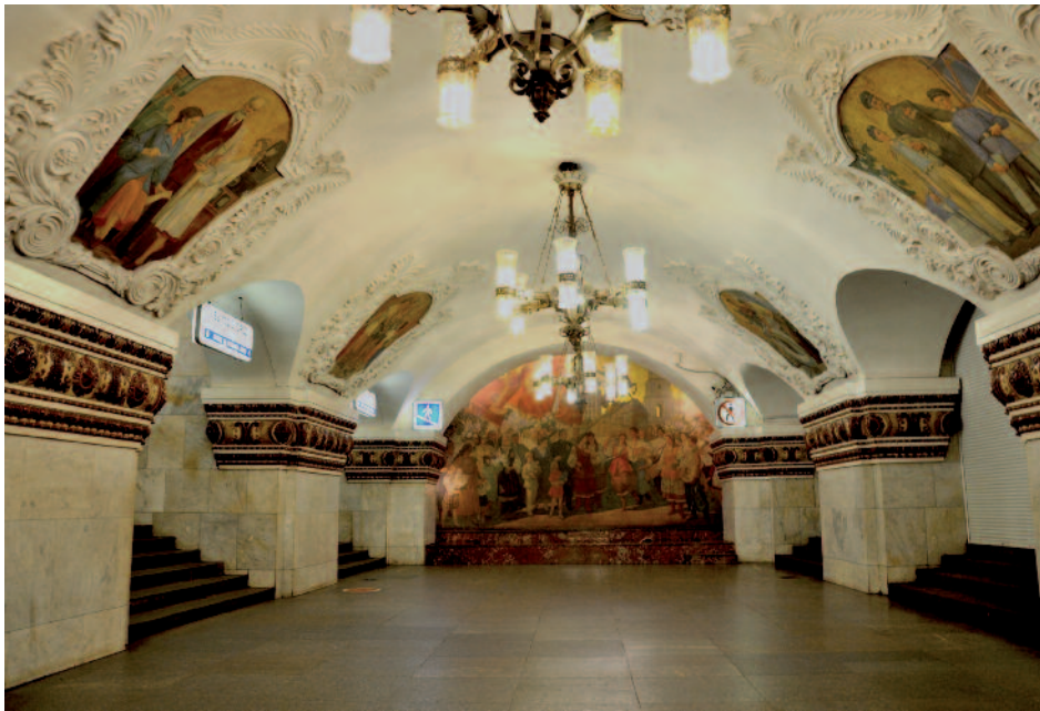
Métro de Moscou

monies du 60 e anniversaire de la Victoire, peut accueillir jusqu'à 4 500 personnes.