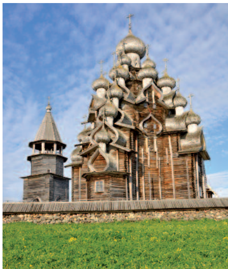
Ile de Kiji

Appareillage pour l'île de Kiji en début d'après midi.