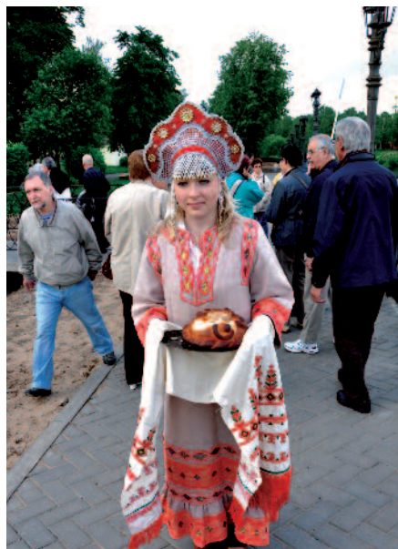
Distribution de pain et de sel