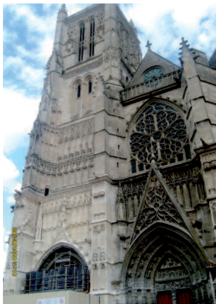
La cathédrale de Meaux