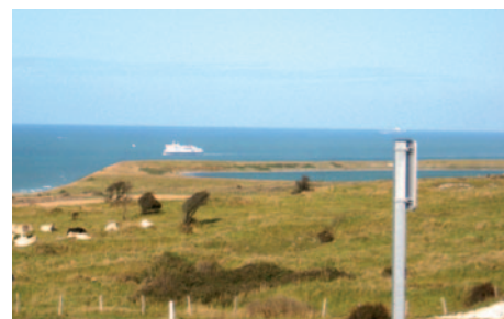
Le cap Gris Nez

par les Anglais en 1544 et rachetée en 1550 par le roi de France qui en fait une fonction militaire. Celle-ci décline avec le recul des frontières entériné par le traité des Pyrénées. Le démantèlement des fortifications coïncide avec les débuts d'une nouvelle économie boulognaise, la pêche constitue toujours