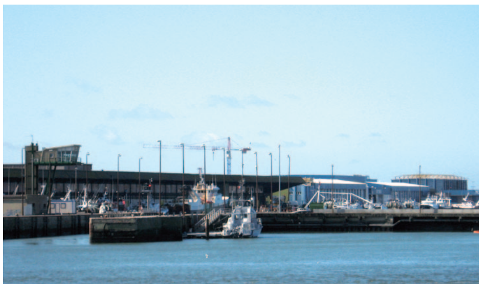
Le port de Boulogne

A la fin du 15 ème siècle Arras sera espagnole pendant 150 ans. Jusqu'alors coupée en deux parties par le Crinchon la ville autour de l'abbaye et la cité épiscopale fortifiée sur la colline ne formeront plus qu'un. Au cœur d'Arras, la Grand'Place et la Place des Héros furent conçues à l'origine pour accueillir des grands marchés. Les maisons qui cernent la « Grand'Place » abritaient les riches grainetiers. Elles furent en partie démolies pendant la première guerre mondiale. La place « des Héros » est quant à elle le berceau du beffroi. Tour de guet servant à prévenir d'éventuelles attaques ennemies, le beffroi d'Arras cousin des beffrois flamands : sera détruit et reconstruit plusieurs fois. Sous le beffroi, l'hôtel de ville, tapissé d'une splendide toile marouflée de 50 mètres de long. En voisine de la cathédrale et au pied de l'ancienne cité Gallo Romaine, nous retrouvons l'Abbaye Saint-Vaast, abbaye bénédictine qui abrite aujourd'hui le musée des Beaux Arts où l'on peut contempler entre autres les trésors archéologiques de la ville ainsi qu'un panorama complet de la peinture française, flamande et hollandaise. Un détour où habitèrent Robespierre et Vidocq qui naquirent à Arras et nous nous mettons en route vers Saint-Omer. Après le déjeuner nous découvrons « le marais Audomarois » qui se présente sous forme de petites par-