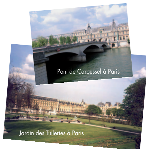
Pont de Carrousel à Paris