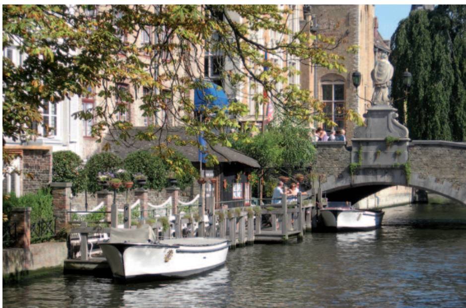
Bruges « Les canaux »