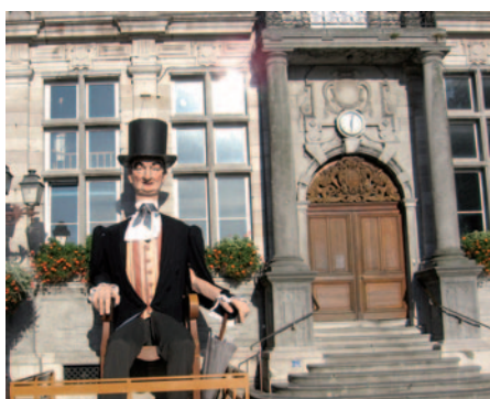
La mairie de Bergues

Ce matin dernier jour de notre séjour et départ vers Douai et Lewarde cœur des anciennes houillères du Nord. C'est en 1982 que fut créée l'association du « Centre Historique Minier » du bassin du Nord Pas-de-Calais avec la participation du ministère de la culture et du conseil régional. Installé sur huit hectares le centre historique minier est un véritable conservatoire de la mémoire de la mine et le musée le plus fréquenté du