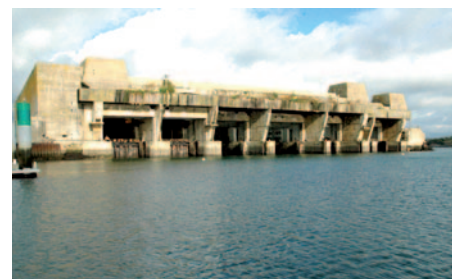
Lorient : la base des sous-marins

Mercredi c'est une sortie à pied en direction de la mer blanche. Sur la côte Est la mer Blanche et le letty séparent Bénodet de Fouesnant, plein sud l'archipel des Glénan et