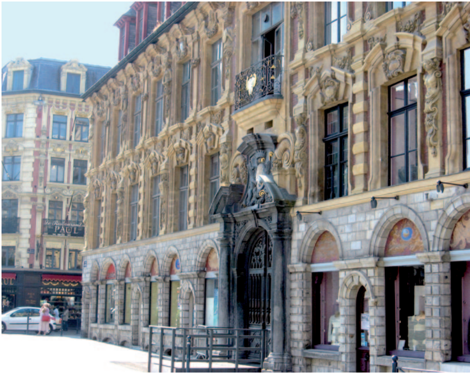
Lille « Le Musée »