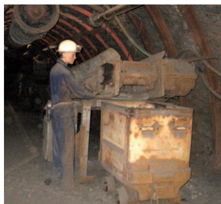
La mine de Lewarde