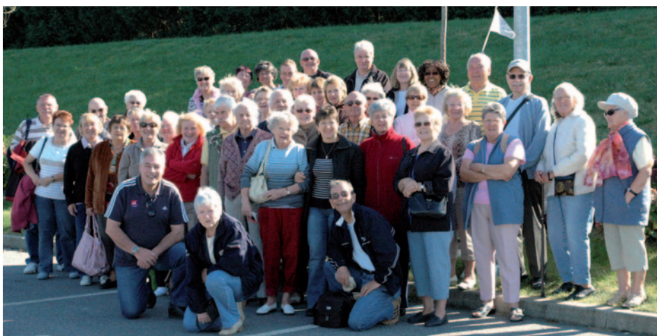
Le groupe LSR à Bénodet

Lundi cap sur les moulins, visite du moulin de Kériolet à quelques pas de la pointe du Millier non loin du phare nous prenons un petit chemin qui nous conduit au cœur d'une vallée protégée où se dresse cet impressionnant moulin. Nous découvrons la grande roue à augets entraînant la pignonnerie en fonte. Le bâtiment a été réhabilité dans le respect des traditions. Au rez de chaussée, tout de bois doré, les meules broyant le blé pour obtenir