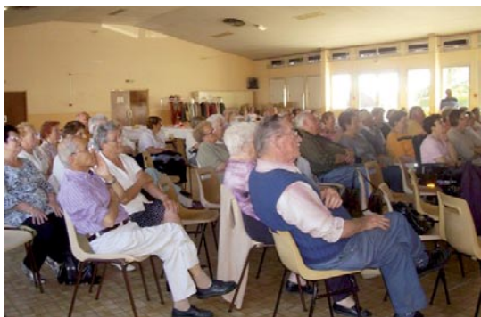
A.G. Centre Loire