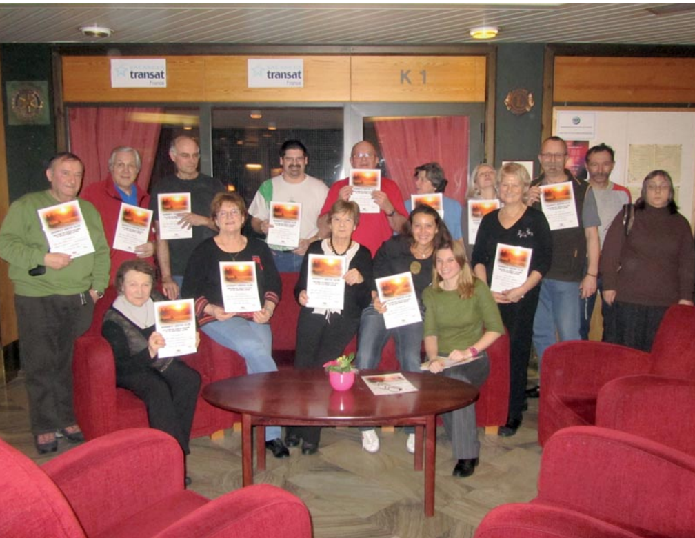
Diplôme reçu après avoir franchi le Cercle Polaire