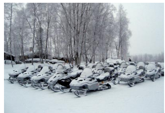
Ivalo, garage motos neige

nous possession de nos machines. Nous commençons notre randonnée sur la rivière gelée d'Ivalo à Palkisoja. Nous nous dirigeons en direction de Saariselkä. Entre bouleaux et conifères le silence semble pesant. Le givre a créé d'étranges figures qui donnent au paysage une allure inquiétante. Sur une piste à peine tracée le groupe avance au rythme de chutes indolentes et des sorties de traces, promenade agréable malgré le bruit des moteurs, mais acceptons les inconvénients de la motorisation nouvelle !!! Notre guide sonne la pause, repas qui est le bienvenu. Un feu est rapidement allumé pour griller les saucisses. En pleine nature nous dégustons une soupe fumante plus garbure que consommé c'est un mélange de morceaux de poulet à différents légumes arrosé de baies chaudes qui nous réchauffe l'intérieur. Mais le temps file et avec lui le peu de jour qu'accorde l'hiver polaire. La caravane bruyante se met en route et serpente à nouveau entre les arbres. Les engins se suivent à la distance réglemen-