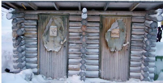
Toilettes du Grand Nord Finlandais