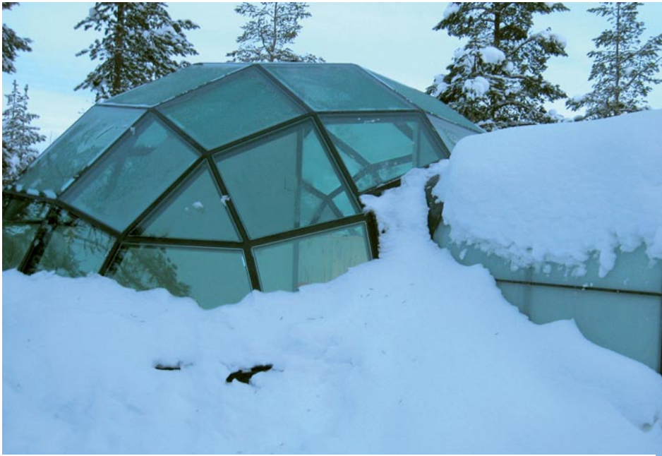
Igloo de verre thermo