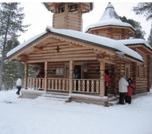
Eglise orthodoxe de Nellin