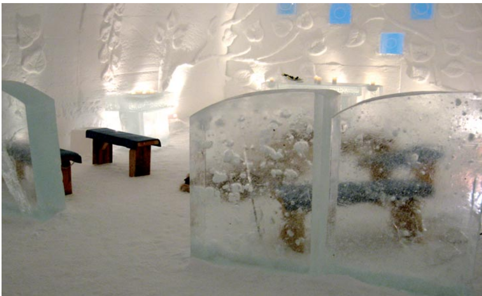
Cathédrale de glace de Kakslauttanen

son n'a voulu se laisser prendre. Après cette expérience nous nous installons autour d'un feu de bois avec une boisson chaude en écoutant notre guide lapon nous narrer cette région et la vie de ses