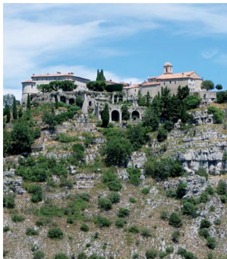
Gourdon, village perché

1 er jour - Après un vol d'1h30, nous atterrissons à Nice ; destination Grasse au village de vacances « Les Cèdres » où nous découvrons un parc méditerranéen et une piscine en plein air. L'installation dans les chambres nous déçoit : le ménage n'a pas été fait !