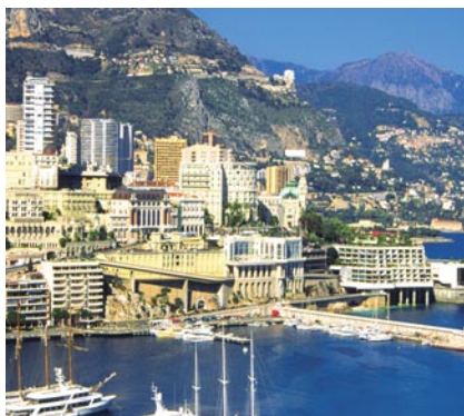
Nice, le port

4 ème jour - Cette journée est consacrée à la Principauté de Monaco située entre Nice et Menton. Le renom international du petit état repose sur sa vocation touristique, le dynamisme de son économie tournée vers l'avenir, et offre aux investisseurs et entrepreneurs un cadre de vie exceptionnel et une fiscalité attrayante. Nous visitons la vieille ville, découvrons le Palais, la cathédrale que nous visitons. Du haut du rocher, nous voyons la réalisation de constructions sur terre-pleins gagnés sur la mer ainsi que le port de plaisance. Des petites ruelles très commerçantes, les jardins Saint-Martin et nous arrivons