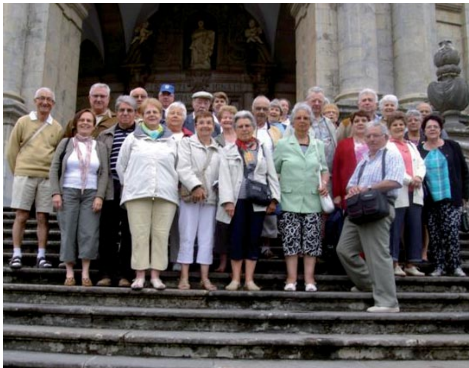
Groupe LSR Centre Loire

Matinée libre. Après midi, destination Bayonne, capitale de la région basque du Labourd. Nous découvrons les vieux quartiers, la cathé-