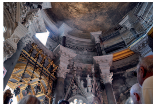
Palais de l'empereur romain Dioclétien

Ce lundi matin nous embarquons pour l'île de Korcula. L'île de Korcula est l'une des plus vertes de la mer Adriatique. C'est une des destinations la plus populaire du sud de l'Adriatique. L'île a la richesse de l'art et de la culture, avec la beauté naturelle des petites plages et des baies. La ville principale sur l'île s'appelle Korcula. C'est une ville fortifiée dalmate typiquement médiévale, avec ses tours rondes défensives