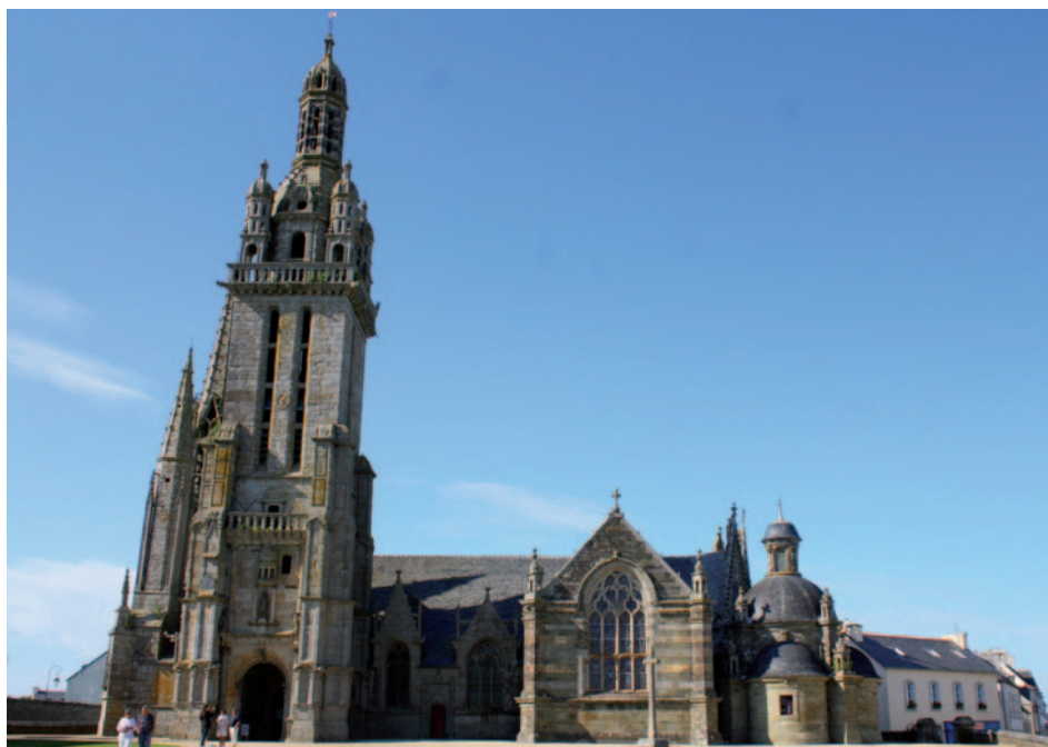
Eglise de Pleyben

Nous poursuivons notre route en traversant les Monts d'Arrée dont le sommet culmine à 380 mètres. La météo nous a abandonnés ! Nous ne pouvons pas profiter du magnifique panorama ; tout « est bouché » pas de chance ! Néanmoins le moral est toujours là. Nous nous dirigeons vers Brennilis à la ferme de Youdig où des surprises et un bon repas nous attendent. Nous pénétrons dans l'enceinte de la ferme où nous repérons tout de suite « la maison de nécessité », où se forme une affluence habituelle à la descente d'un car. A la salle à manger, typiquement bretonne, nous sommes accueillis par la maîtresse des