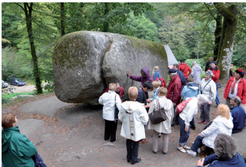
Groupe LSR - La roche tremblante de Huelgoat

lieux. Dame fort sympathique, chaleureuse même sous un faux air bourru. Nous nous installons à table, tant bien que mal les places étant étroites pour certains d'entre-nous assis sur un banc le dos appuyé au buffet ! Mais les plats servis sont surprenants et délicieux, tel le Kig Ha Farz, l'éventuel inconfort disparaît. Ensuite, après quelques déplacements nous faisons place aux danseurs de gavotte. Cette démonstration nous fait découvrir la résistance physique de ces jeunes femmes et jeunes