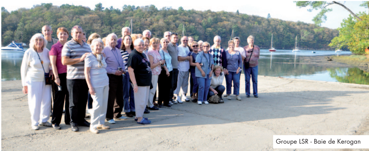
Groupe LSR - Baie de Kerogan