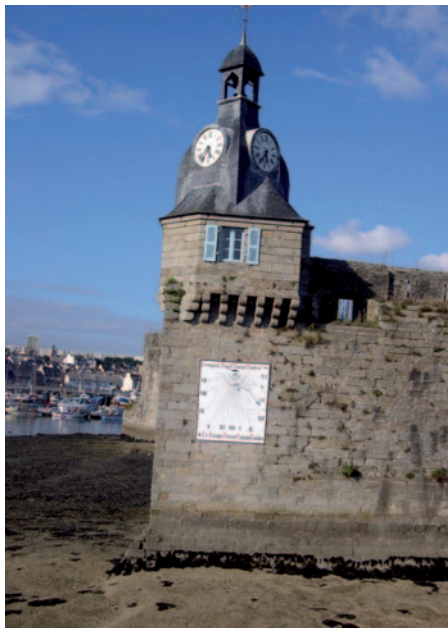
Rempart de Concarneau

travail ont été nécessaires pour réaliser ce village avec un souci du détail.