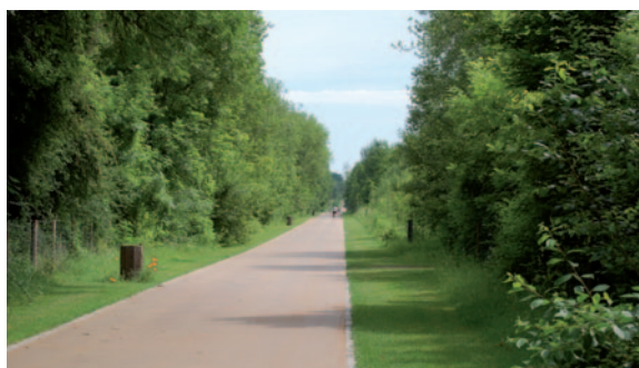
Parc de la Haute Ile à Neuilly sur Marne

de « Saint Mandé à Saint Michel » par les jardins de Reuilly, le bassin d'Arsenal, le canal Saint Martin, l'île de la cité.