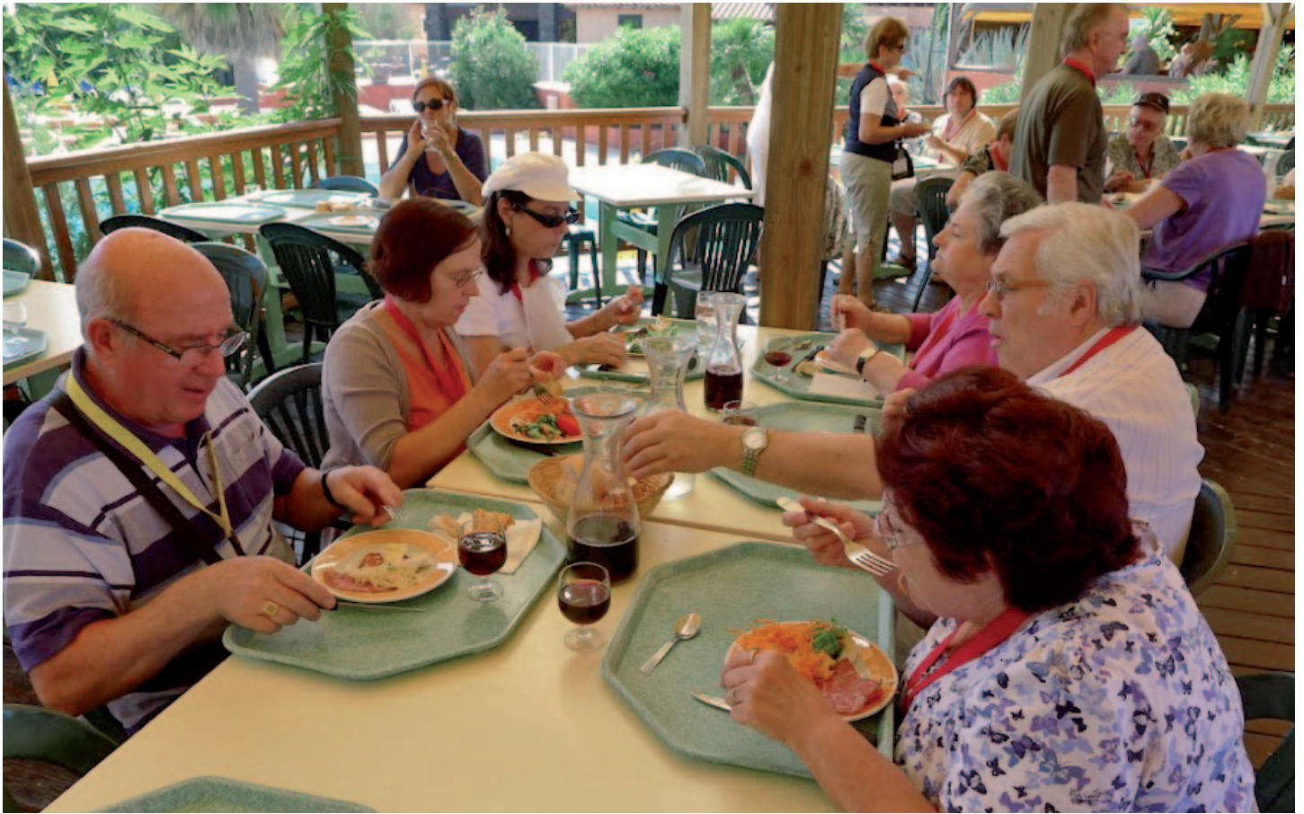
Délégation LSR-RATP et Centre Loire

monie du corps et de l'esprit ». Il n'est pas étonnant, dès lors que, lancée par LSR, la proposition d'une rencontre nationale au Mont Dore, avec l'Ancav-TT, La FSGT et LSR, ait reçu l'assentiment unanime de l'Assemblée générale.