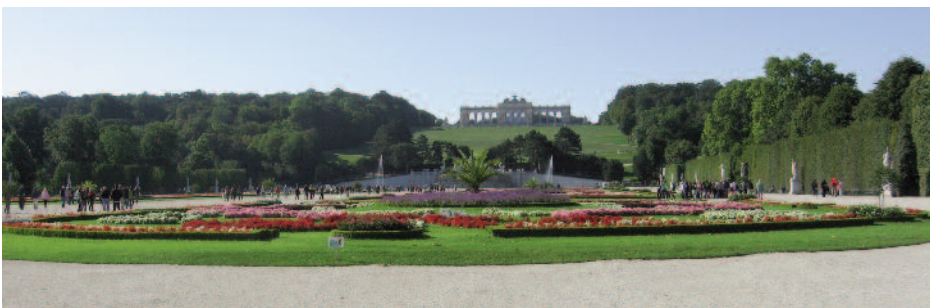
Jardins du château de Schonbrun

Schöbrunn (le Versailles autrichien) le plus important des monuments d'Autriche, classé au patrimoine de l'Unesco depuis 1996, d'un style baroque, d'une quarantaine de pièces décorées. L'ensemble comprend le château, les dépendances, le parc, de nombreux édifices, ses fontaines, ses statues, le jardin zoologique et en face, la Gloriette propriété des souverains habsbourgeois depuis Maximilien II.