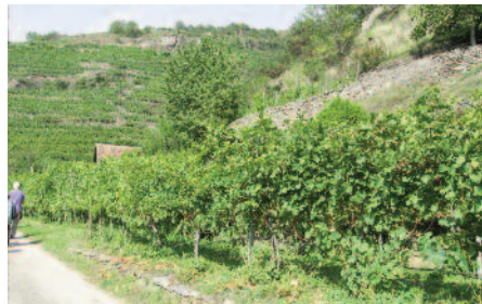
Les vignes de Wachau

Un arrêt à Krems und Stein deux villes jumelles qui s'élèvent au bord du Danube, au pied de collines couvertes de vignobles