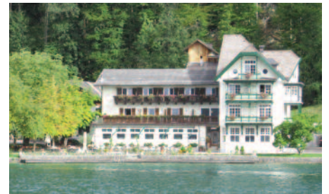
Le lac de Salzkammagut

bell fut la résidence de l'archevêque Von Raitnau et de Salomé Alt sa maîtresse, elle en eut 15 enfants dont dix survécurent. La salle des marbres, autrefois salle de réception des archevêques, est l'une des plus belles salles de mariage au monde.