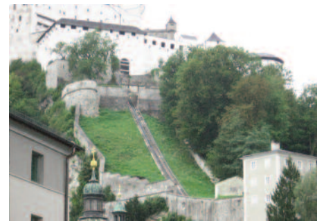
Salzbourg, le funiculaire

Salzbourg a vu naître Mozart le 27 janvier 1756. L'après-midi visite libre, toujours sous la pluie, une balade dans les jardins face au château de Mirabell (ancienne résidence des princes archevêques. Mira-