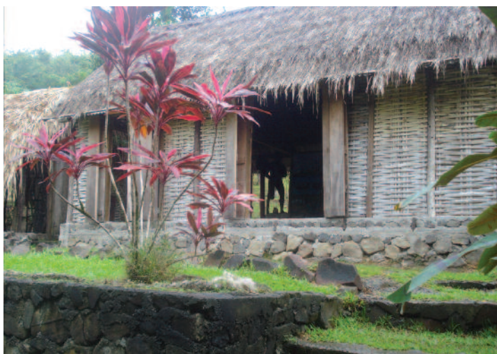
Rempart de Concarneau

Départ de l'hôtel à 8h. Nous nous arrêtons à Pointe à Pitre pour faire le marché typique avant de partir pour le Sud Basse