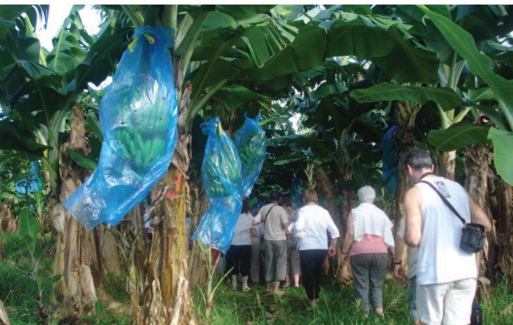
Rempart de Concarneau

les personnes qui veulent se baigner dans la baignoire de Joséphine, un fond blanc, endroit où l'on a pied. Petite anecdote : Joséphine était un bateau. L'impératrice Joséphine n'y a jamais mis les pieds.