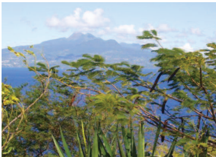
Rempart de Concarneau

à Pitre pour Grand Bourg. Le programme prévu n'est pas réalisé. Par contre, nous garderons un très bon souvenir d'une promenade en pédalo dans la mangrove. Nous visitons aussi une fabrication de miel, de farine de manioc et bien sûr, une distillerie de plus !