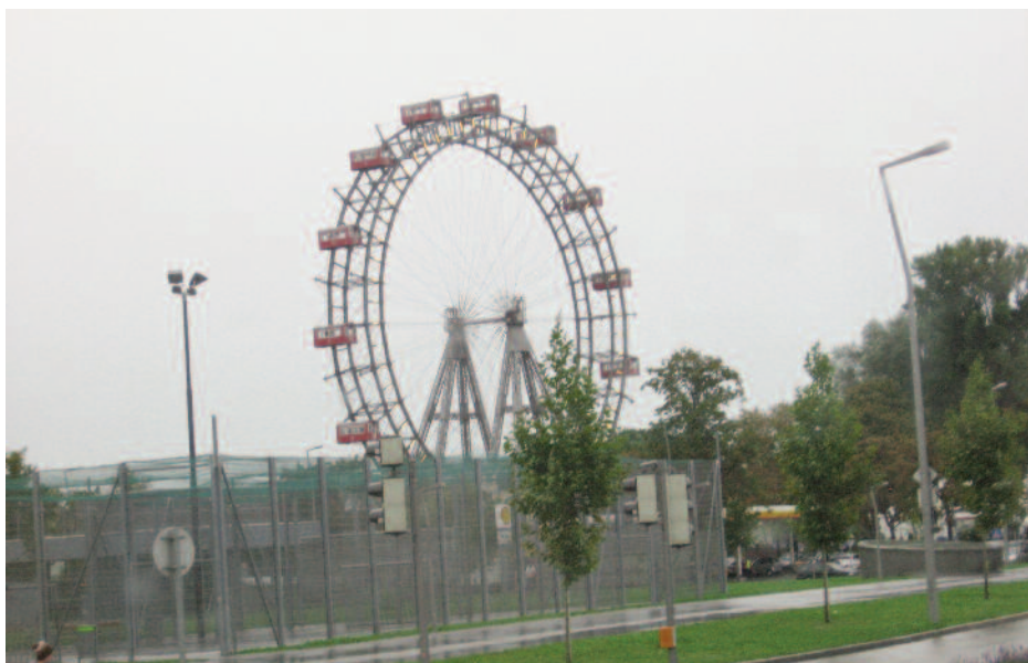
Vienne, visite du Ring