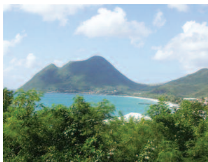
Rempart de Concarneau