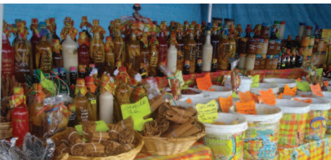
Rempart de Concarneau