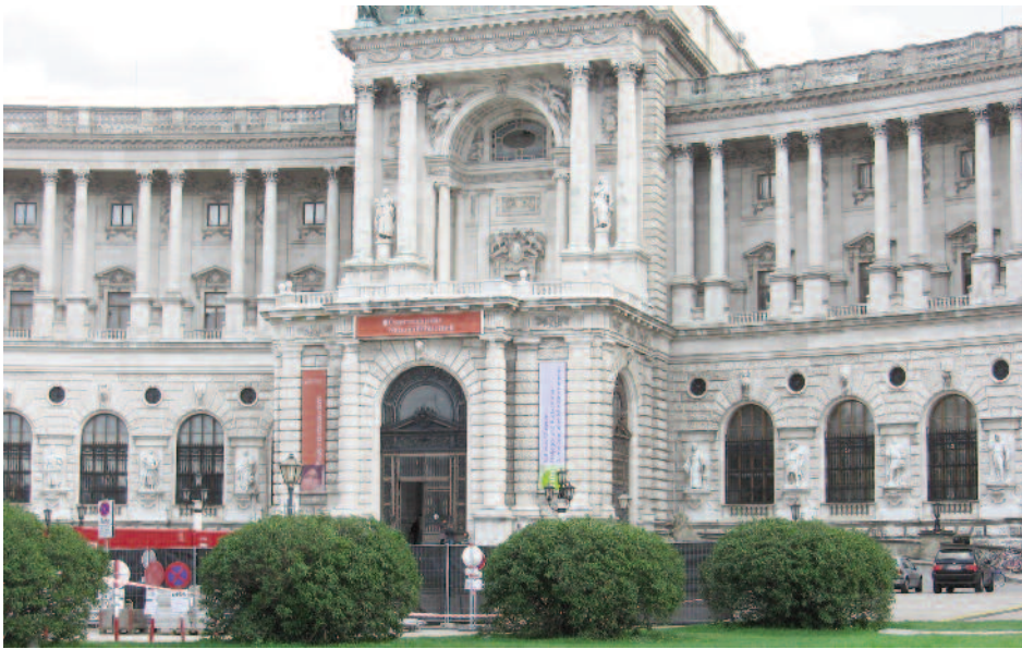
Vienne, musée de Sissi