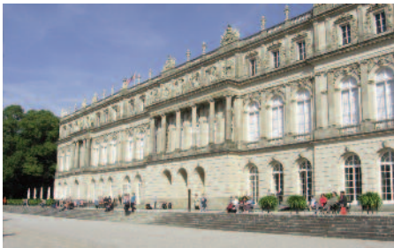
Château de Louis II

prise : découverte du Château de Herrenchiemsee sur une petite île au milieu du lac Chiemsee, musée du Roi Louis 2. Le Roi Louis 2 de Bavière monté sur le trône à 18 ans se retira de plus en plus du monde. Il se passionna uniquement pour le théâtre royal et inventa sans cesse de nouveaux décors pour la scène de vie, son rêve le plus important (« son Versailles », après les voyages qu'il effectua en France en 1867 et 1874)