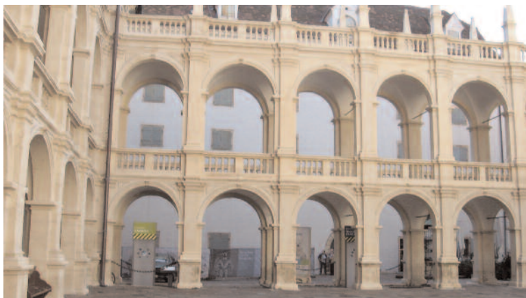
Graz, la cour du Landhaushof

La Grand Place et l'Hôtel de Ville forment le cœur de cette vieille ville, au centre de l'Hauptplatz trône une fontaine construite en 1878 à la