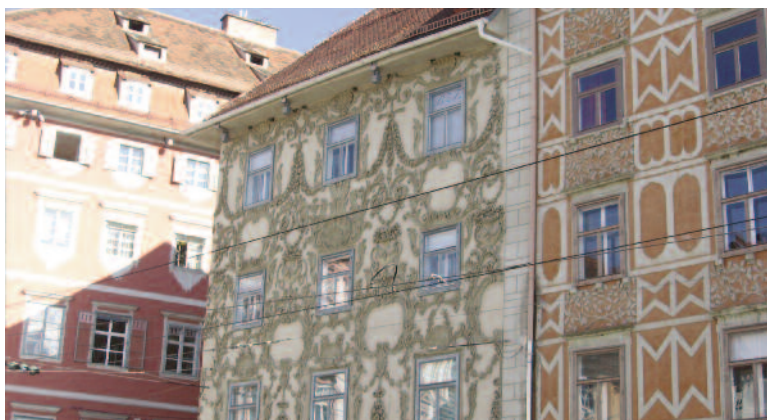
Graz, centre ville

●●● Le dernier jour, nous arrivons à Graz capitale de la Styrie , ici une autre ambiance, bercée par la douceur de vivre méditerranéenne. On sent les influences des pays alentours que sont l'Italie, la Slovénie et la Hongrie, tout en conservant un style autrichien. Comme il est agréable de flâner dans les rues de Graz et découvrir ses secrets architecturaux et culturels. La Cathédrale élevée par Frédéric II au 15 ème siècle