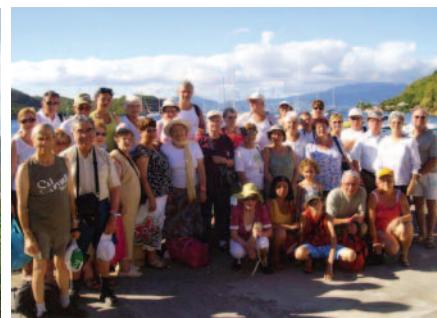
Rempart de Concarneau