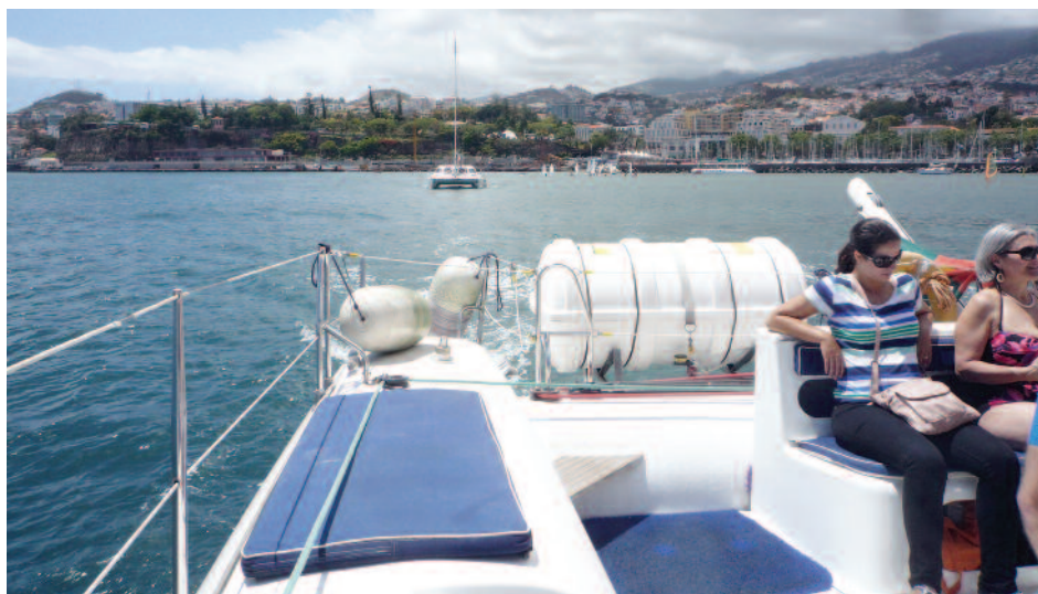
Visite d'un catamaran

Un orchestre folklorique, composé de six musiciens : tambour, guitares, accordéon,