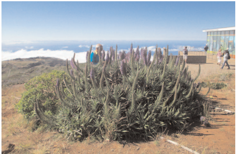
Parc national de Madère

et à droite de l'Hôtel de Ville de Funchal autour de la place principale. Comme son nom l'indique, ce Musée est consacré aux œuvres d'art à caractère religieux : dont tableaux du Christ, de la Vierge, des Saints et triptyque venant de la cathédrale et d'autres églises de Madère ; magnifique collection de peintures flamandes