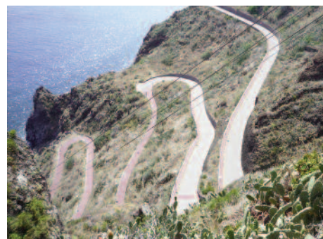
Route de montagne

Aurélio nous explique que l'espada, pois-