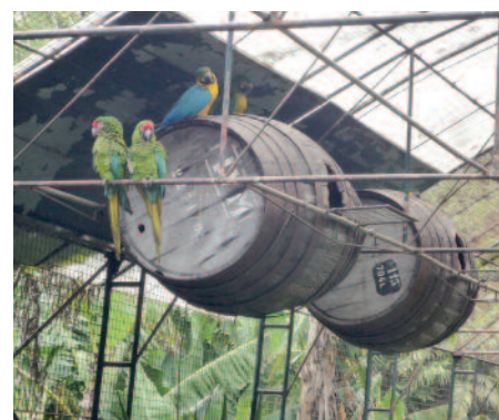
Musée de Pico Dos Barcelos

Nous prenons la route de la montagne pour atteindre le belvédère d'EIRA DO SERRADO et le restaurant qui domine le village de CURRAL DES FREIRAS (prison ou refuge des Nonnes). Ce lieu a été ainsi nommé car en 1566, environ, 2000 corsaires se sont installés là. Ils étaient commandés par Belize de Montluc (un Français) et ont massacré environ 500