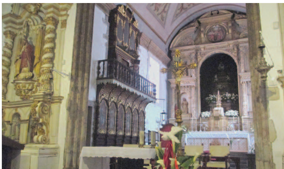
Notre Dame du Mont

gués et l'arrêt déjeuner, au restaurant Apolo déjà connu, est bienvenu.