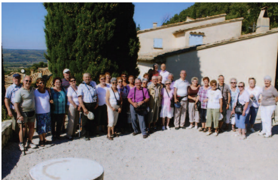
Groupe LSR centre Loire