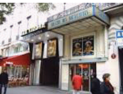
Théâtre des Nouveautés

Le 2 juillet exposition « PICASSO » visite guidée