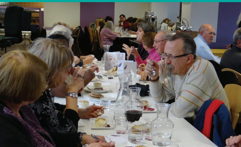
REPAS GALETTE 2015

BULLETIN D'INFORMATION SEMESTRIEL - N° 44 - JUIN 2015