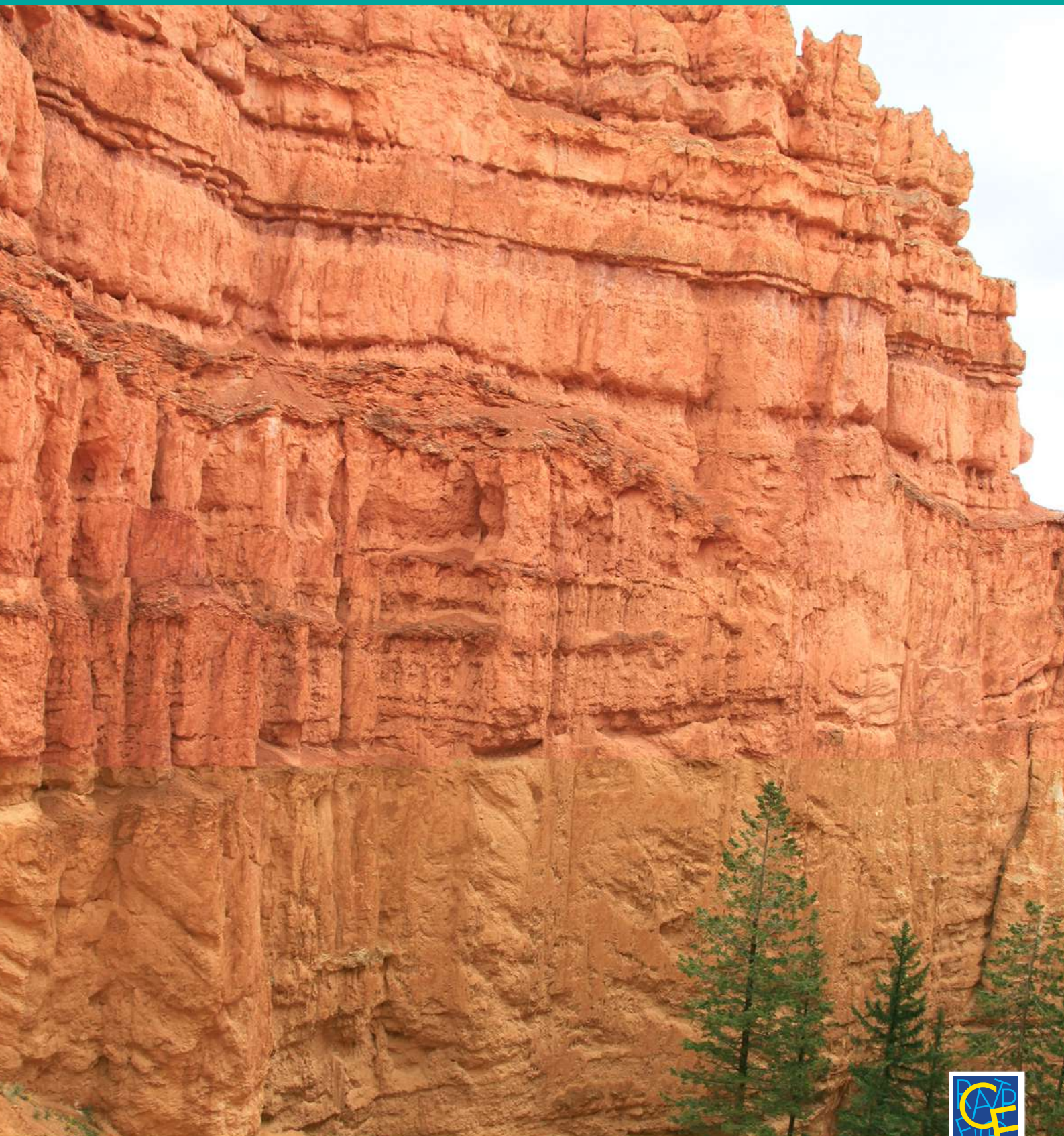
BRYCE CANYON LAS VEGAS

BULLETIN D'INFORMATION SEMESTRIEL - N° 45 - JUILLET 2016