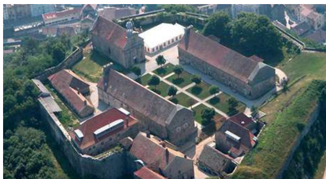
Les salines à Salins les Bains

Après notre déjeuner au restaurant le Ranch, nous avons visité les Salines Royales d'Arc et Senans.. 1200 ans d'histoire du sel... Depuis le VIIIème siècle, Salins-les-Bains a su tirer profit d'un don exceptionnel de la nature : le sel ou "Or Blanc". C'est grâce au captage de l'eau salée et son évaporation, que la ville a acquis sa prospérité. Les Comtes de Bourgogne, propriétaires des salines ont fini par laisser la place aux Rois de France. C'est Louis XIV qui a intégré, la Grande saline dans le bail des Fermes et Gabelle la rendant ainsi manufacture royale. La ville a pu poursuivre ainsi sa croissance jusqu'à son déclin progressif jusqu'en 1962