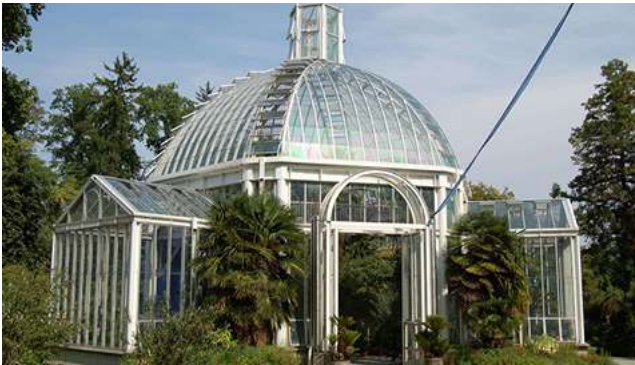
Les jardins botaniques au bord du Lac Léman

Départ 9h, pour la visite de la grande cave d'affinage de Comté au Fort des Rousses. Plus de 50.000m 2 de salles voûtées. Au cœur du Parc Naturel du Haut Jura à 1.150m d'altitude, au cœur d'un fort militaire remarquablement aménagé, les caves d'affinage des Comtés «Juraflore» et l'histoire des plus grands fromages de la Franche Comté. Visite guidée de la cave Charles Arnaud, avec son fantastique demi-cintre en pierres de 214m de longueur. Plus de 77.000 fromages s'affinent. Visite suivie d'une dégustation.