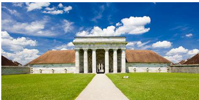
Salines Royales d'Arc et Senans

Départ à 9h pour la visite des salines à Salins les Bains : 1000 ans d'histoire du sel et de son exploitation en Franche Comté. Découverte de magnifiques galeries souterraines du XIIIème siècle, abritant un système de pompage hydraulique encore en fonctionnement.