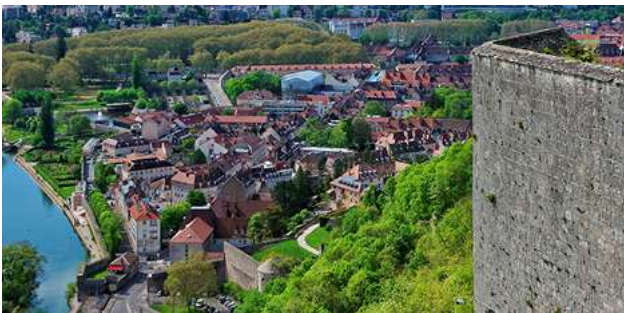
Besançon et sa citadelle "Vauban"

Départ 7h30 pour la visite la capitale comtoise de Besançon et sa citadelle "Vauban". Préservée des atteintes et des fracas de l'histoire, comme par miracle, Besançon n'est pas une ville comme les autres.